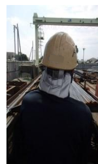
ヘルメットに日よけ用の布