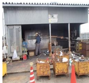
屋根付き作業場の確保