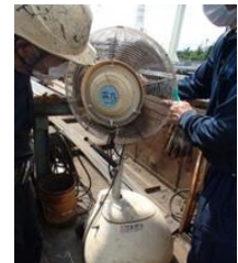
ミスト扇風機の設置