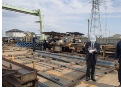
資材保管場所の工夫