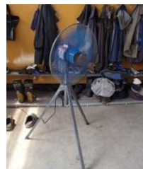
業務用扇風機の導入