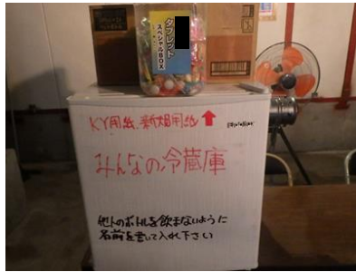
冷蔵庫の設置/塩飴常備