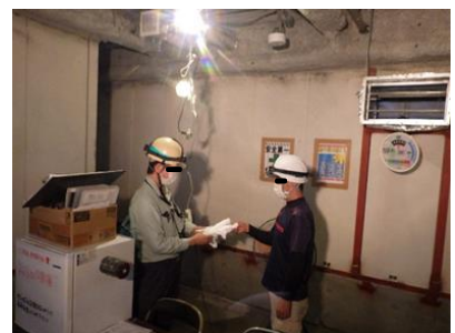
凍らせたタオル等を配布