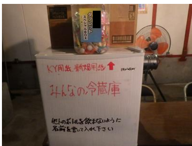
冷蔵庫の設置/塩飴常備