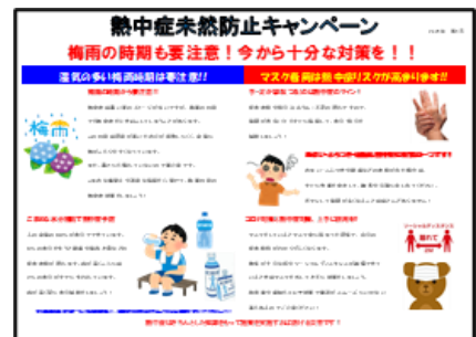
教育資料：熱中症未然防止キャンペーン