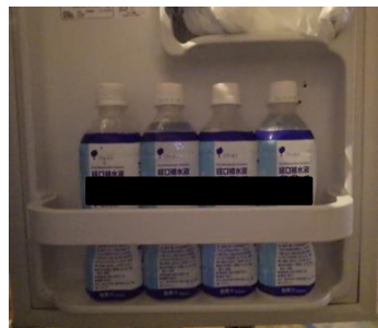
経口補水液等を会社支給で常備