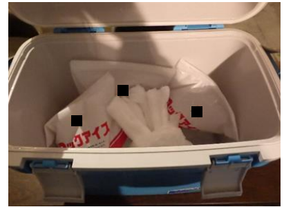
クーラーボックスを設置