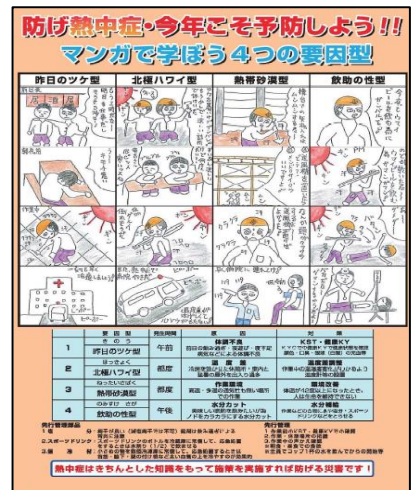
オリジナルポスター