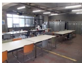
【写真 17】解体中のビル内休憩場所