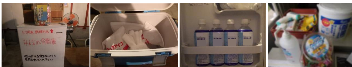
【写真 21】冷蔵庫の設置/塩飴常備