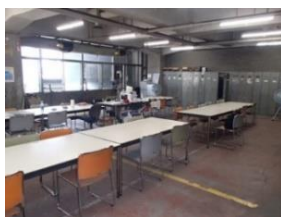
【写真 11】解体中のビル内休憩場所