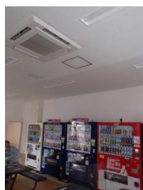
【写真 20】休憩場所に飲料自動販売機の設置