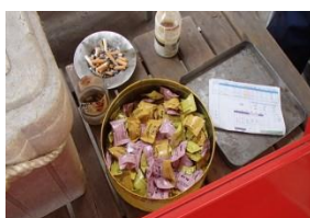
【写真 25】塩飴で塩分補給