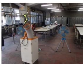
【写真 16】業務用扇風機・スポットクーラーを設置