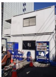
【写真 19】屋外にある建設事務所前に飲料自動販売機を設置