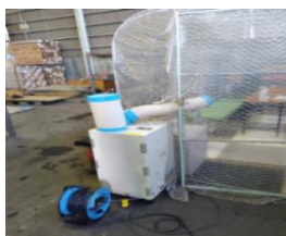
【写真 10】休憩場所の確保（スポットクーラー）