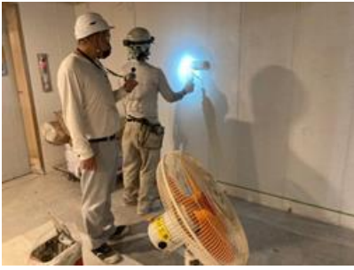
作業場所ごとに WBGT 値を測定している様子