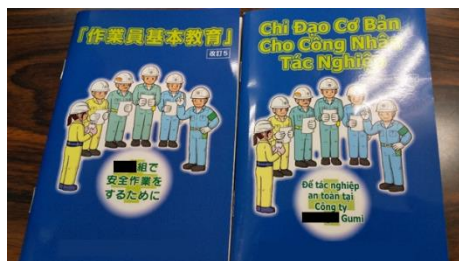
「作業員基本教育」冊子（日本語・中国語・ベトナム語・・・）