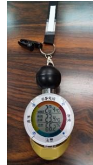
黒球付き WBGT 指数計